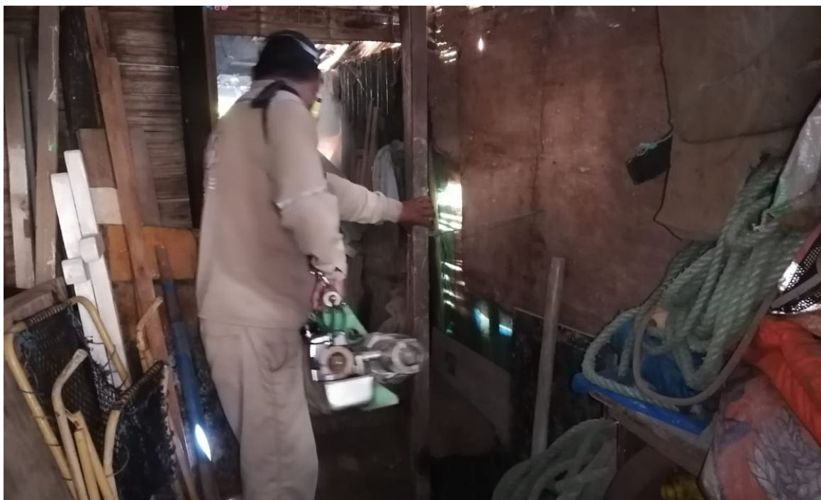
Fumigación en el distrito de Contralmirante Villar III ciclo, Tumbes.